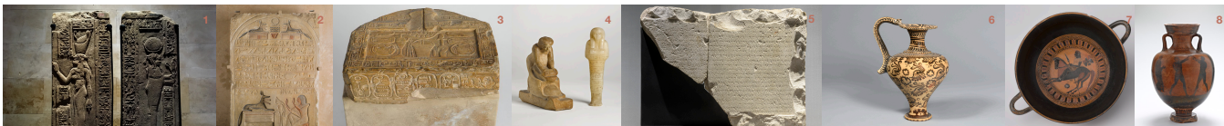
Photo © Amphore panathénaique (9 e siècle avant J.-C.) - © Musée de Marseille / David Giancarina

Édifice du XVII e siècle, le Centre de la Vieille Charité est un lieu emblématique de la Ville de Marseille : classé au titre des Monuments Historiques en 1951, il devient en 1986 un centre pluridisciplinaire dédié aux arts et à la recherche, abritant le Musée d'Archéologie Méditerranéenne (MAM - 1 er étage), le Musée d'Arts Africains, Océaniques, Américains (MAAOA - 2 e étage), des salles d'expositions temporaires, l'École des Hautes Études en Sciences Sociales (EHSS - 2 e étage), le Centre International de Poésie de Marseille (CIPM - rez-de-chaussée). Il propose tout au long de l'année une riche programmation culturelle.