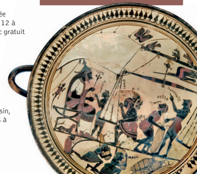
Coupe Terre cuite, figures noires sur fond blanc Attribuée au Peintre d'Arcésilas Laconie, vers 565-560 av. J.-C. Vulci (Italie) Bibliothèque nationale de France

Pour les visites et les ateliers pédagogiques au 04 91 55 36 00 ou sur musee-histoire-marseille-voie-historique.fr