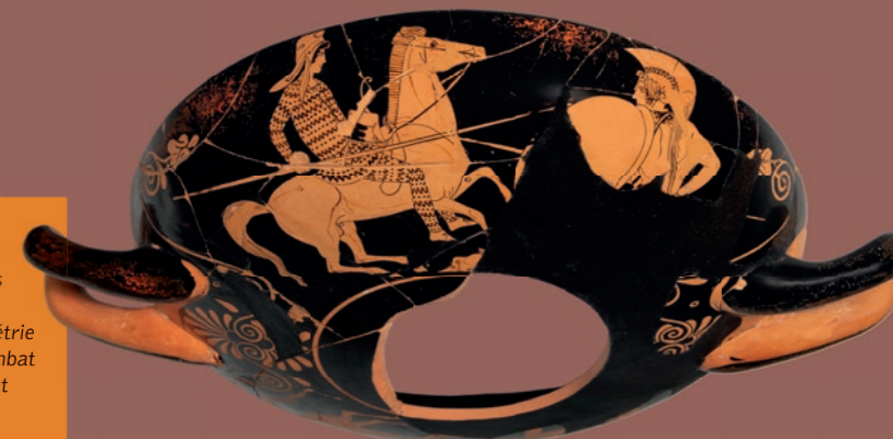
Coupe Terre cuite, figures noires Attribuée au Peintre d'Erétrie Décor de combat entre Grecs et Amazones Athènes, vers 425-420 av. J.-C. Fouilles rue Leca, Marseille Musée d'Histoire de Marseille