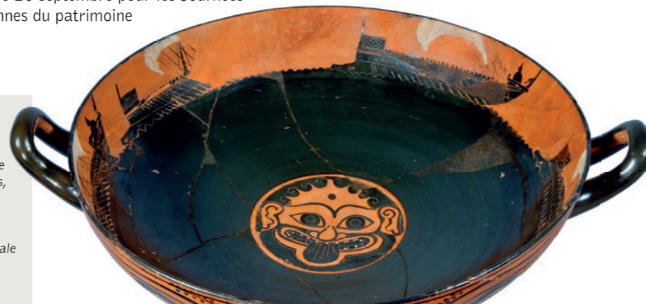
Coupe Terre cuite, figures noires Attribuée au Groupe de Léagros, Athènes, vers 510 av. J.-C. Cerveteri, Monte dell'Oro Bibliothèque nationale de France