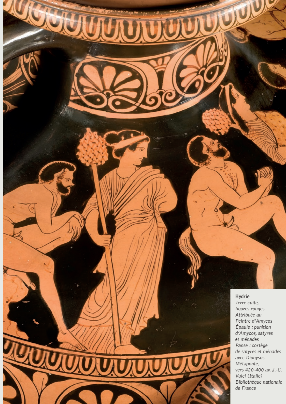
Hydrie Terre cuite, figures rouges Attribuée au Peintre d'Amycos Épaulé : punition d'Amycos, satyres et ménades Panse : cortège de satyres et ménades avec Dionysos Métaponte, vers 420-400 av. J.-C. Vulci (Italie) Bibliothèque nationale de France

• En octobre et novembre (sous réserve) Hors les murs, séances spéciales en partenariat avec les cinémas Le Gyptis et La Baleine INFORMATIONS labaleinemarseille.com et lafriche.org/fr/cinema-le-gyptis Tarifs habituels des cinémas