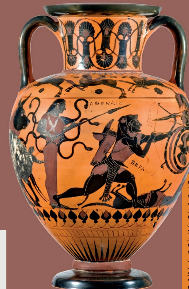
Amphore à col Terre cuite, figures noires Attribuée au Peintre des Inscriptions. Face A : Héraclès combat le triple Géryon sous la protection d'Athéna. Face B : quadriga frontal Atelier chalcedien (Reggio de Calabre), vers 530 av. J.-C. Vulci, 1828-1829. Bibliothèque nationale de France